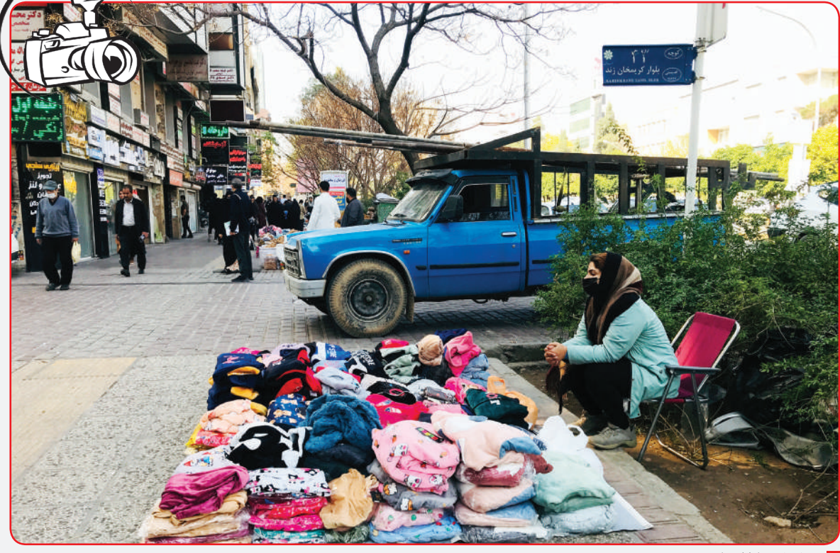
دستروش - خیابان رنده