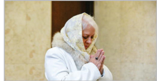
مراسم روز سرکیس مقدس