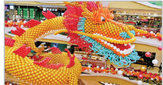
آژدهای چینی ساخته شده از بادکنک به مناسبت سال نو چینی