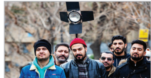
اجرای خیابانی جشنواره تئاتر فجر