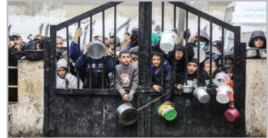
انتظار در صف دریافت غذای رایگان در شهر فح - جنوب نوار غزه