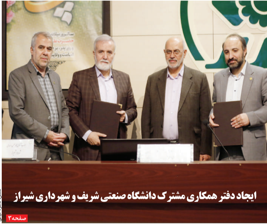
ایجاد دفتر همکاری مشترک دانشگاه صنعتی شریف و شهرداری شیراز