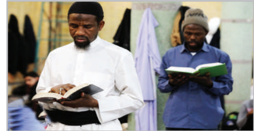
اعتکاف طلاب غیر ایرانی - قم