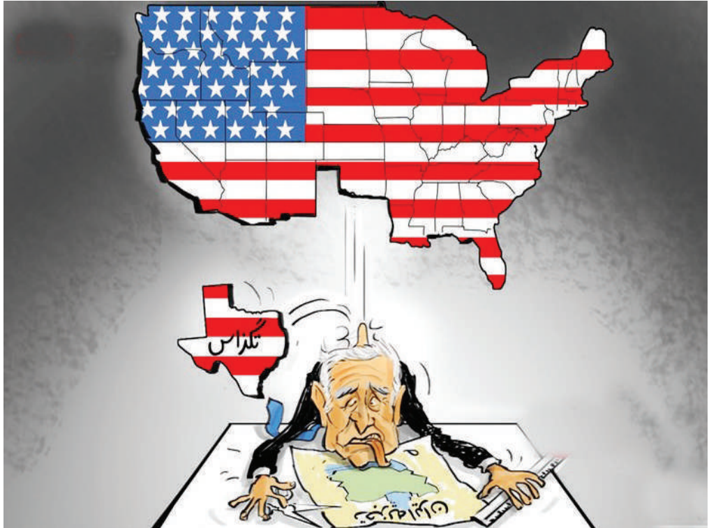
جدایی تگزاس؛ هشدار جنگ داخلی در آمریکا